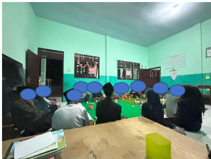
Gambar 1. Edukasi Hidup Sehat tanpa Merokok di Dusun Krajan Desa Sukorambi

Seluruh tahapan kegiatan terlaksana sesuai dengan rencana yang telah disusun. Kegiatan diawali dengan registrasi peserta dan pemberian pretest untuk mengukur tingkat pengetahuan awal remaja mengenai bahaya merokok. Selanjutnya dilakukan penyampaian materi edukasi kesehatan menggunakan metode ceramah interaktif mengenai pengertian merokok, kandungan zat berbahaya dalam rokok, jenis-jenis rokok, dampak merokok terhadap kesehatan, serta tips berhenti merokok. Dalam kegiatan ini, peserta juga diberikan leaflet dan poster edukatif sebagai media pembelajaran untuk membantu memahami materi yang disampaikan. Setelah sesi penyampaian materi selesai, kegiatan dilanjutkan dengan diskusi interaktif dan tanya jawab, kemudian diakhiri dengan pemberian posttest untuk mengevaluasi perubahan tingkat pengetahuan peserta setelah mengikuti edukasi kesehatan (Gambar 1).