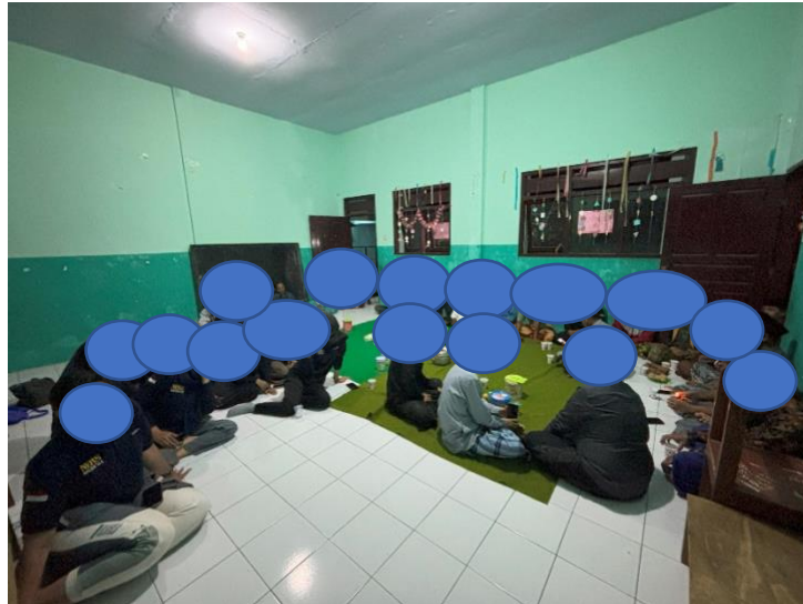
Gambar 3. Antusiasme Masyarakat pada Penyuluhan Merokok di Dusun Krajan Desa Sukorambi

merokok terhadap kesehatan jangka panjang. Leaflet dan poster edukatif digunakan peserta sebagai media untuk memahami materi yang disampaikan oleh tim pengabdian masyarakat. Antusiasme peserta terlihat dari keterlibatan aktif selama sesi tanya jawab dan diskusi berlangsung hingga kegiatan selesai (Gambar 3).